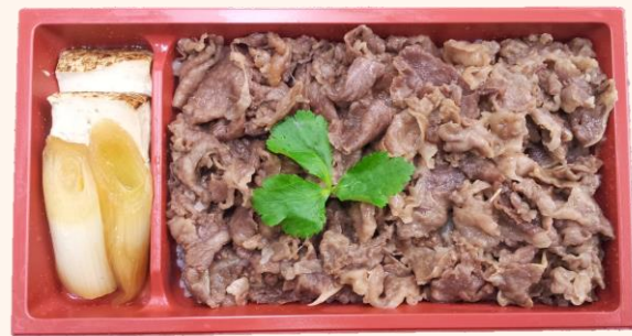
国産牛すき焼き御膳(A-16) 税込価格 1,050円