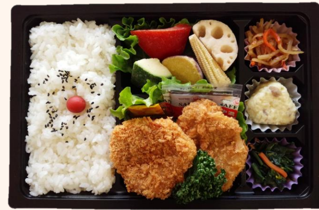
ひれカツ&蒸し野菜弁当(A-5) 税込価格 1,000円