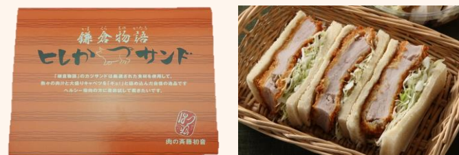
ヒレかつサンド 税込価格 680円