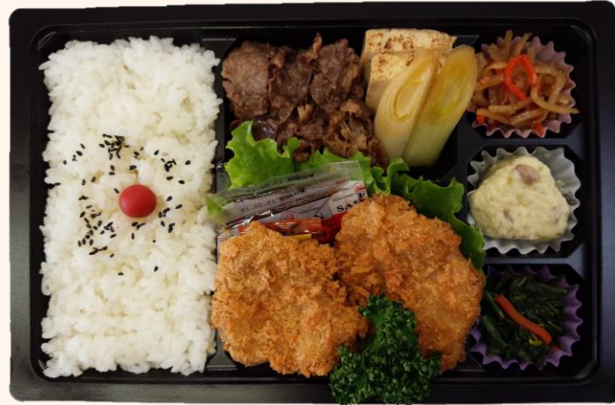
ひれカツ&すき焼き弁当(A-3) 税込価格 1,350円

季節に応じてお弁当の内容を変更しております。 商品画像と異なる場合が御座いますので、予めご了承ください。