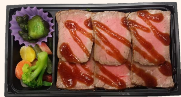
黒毛和牛ステーキ御膳(A-15) (やわらかくて脂の少ない赤身肉ステーキが 入った人気の一折) 税込価格 1,100円