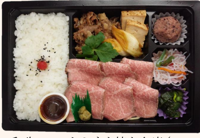
和牛ロースト&すき焼き弁当(A-12) 税込価格 2,000円