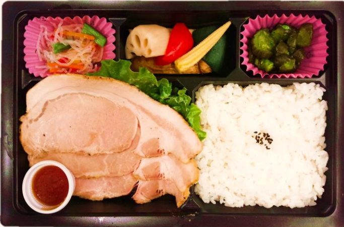
やわらかポーク御膳(A-13) (独自の製法で、やわらかく焼き上げ、 豚肉の美味しさを引出しました) 税込価格 1,000円