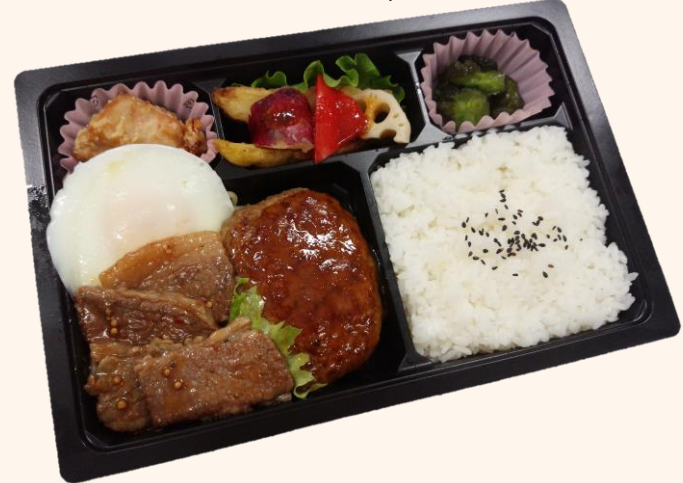
焼肉&ハンバーグ御膳(A-14) (お肉料理を盛り合わせた一折) 税込価格 1,100円